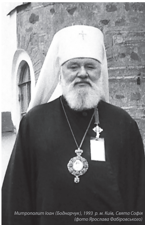
Митрополит Іоан (Боднарчук), 1993 р. м. Київ, Свята Софія

Митрополит Іоан (Боднарчук) народився 12 квітня 1929 р. в с. Івано-Пусте Борщівського району Тернопільської області. За радянських часів закінчив Ленінградські духовні семінарію та академію, перебував у таборах. 11 жовтня 1977-го в Почаївський лаврі було звершено його постриг у чернецтво. З 1989 року архієрей був активним учасником національно-церковного руху в Україні.